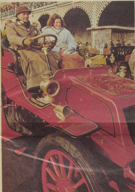
«Old Cocks»-Rennen: Jedes Jahr zockeln Oldtimers im Schneckentempo von London nach Brighton. Wetteifern ist verboten. Dagegen ist es erlaubt, dass die Damen aussteigen und schieben. Hier ein Clement Talbot, Modell 1903.

Das keltische Sonnenheiligtum Stonehenge im südlichen England, wo die Sage des 3800 Jahre alten Druidentempels lebendig wird.