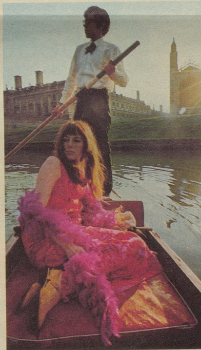
Rudern auf der Cam, einem der romantischsten Flüsse der Welt. Für nur 5 Shillinge können Sie sich in unbeschwerte Studentenzeit zurückversetzen.