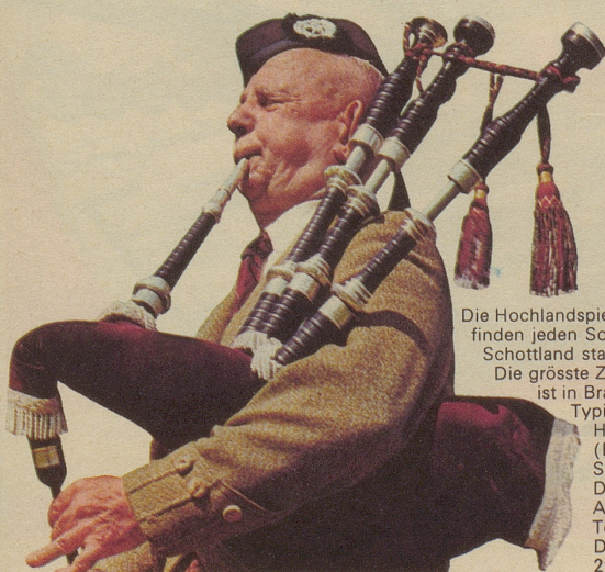
Die Hochlandspiele finden jeden Sommer in Schottland statt. Die grösste Zusammenkunft ist in Braemar am 19. Juli. Typische Sportarten: Hammerwerfen, «Caber» (Baumstämme stossen), Schwerttanz bei Dudelsackmusik. Andere Spiele: in Tobermory am 20. Juli. Das Treffen der Clans: 29. Juli.