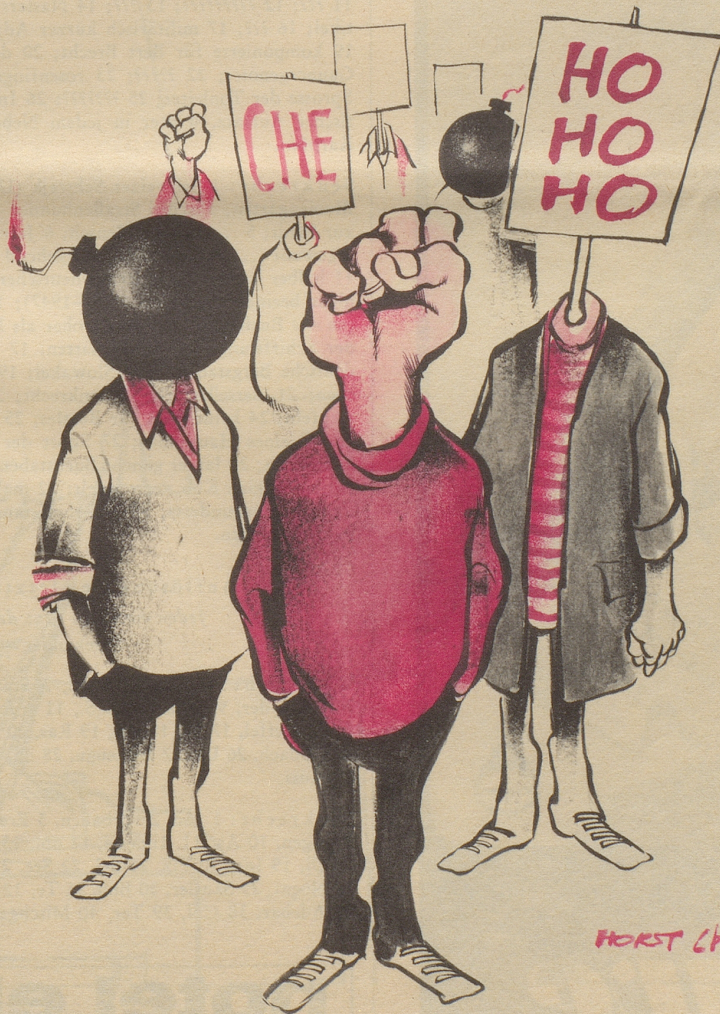
Die geistige Elite

Anlässlich des SPD-Parteitages in Nürnberg haben demonstrierende Studenten die Minister Brandt und Wehner tätlich angegriffen!