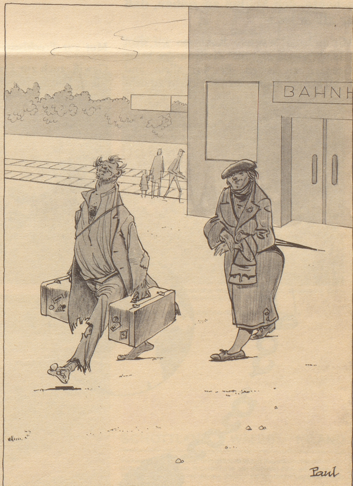
Fortunatus, der Seltene

«Das ist ein Knollenblätterpilz; merken Sie sich, die Lamellen sind immer ganz weiß.»