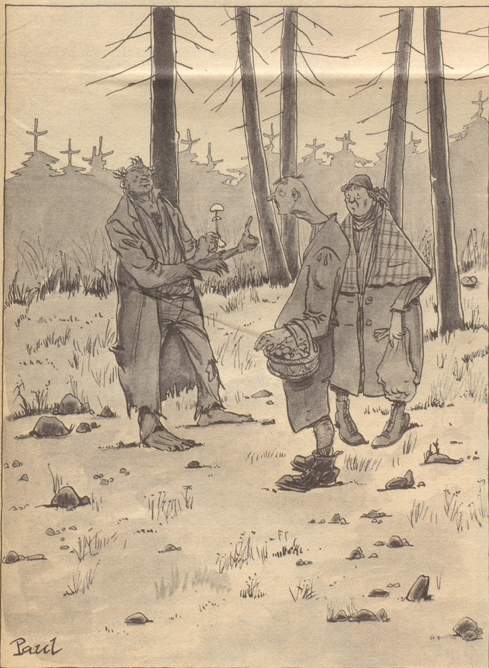
Fortunatus, der Mensch

«Das ist ein Knollenblätterpilz; merken Sie sich, die Lamellen sind immer ganz weiß.»