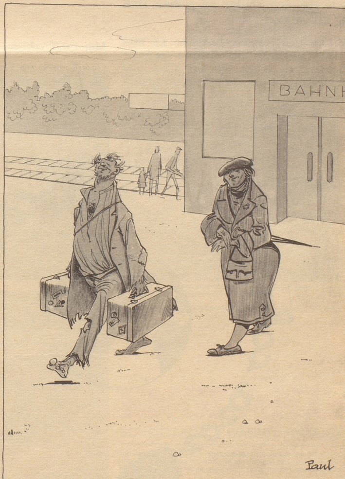
Fortunatus, der Seltene

«Das ist ein Knollenblätterpilz; merken Sie sich, die Lamellen sind immer ganz weiß.»