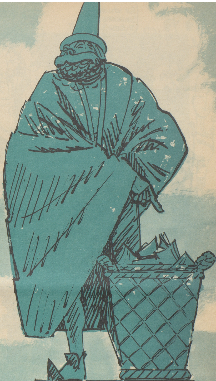
DEM WOHLTÄTER DER MENSCHHEIT: DEM UNBEKANNTEN ERFINDER DES PAPIERKORBES