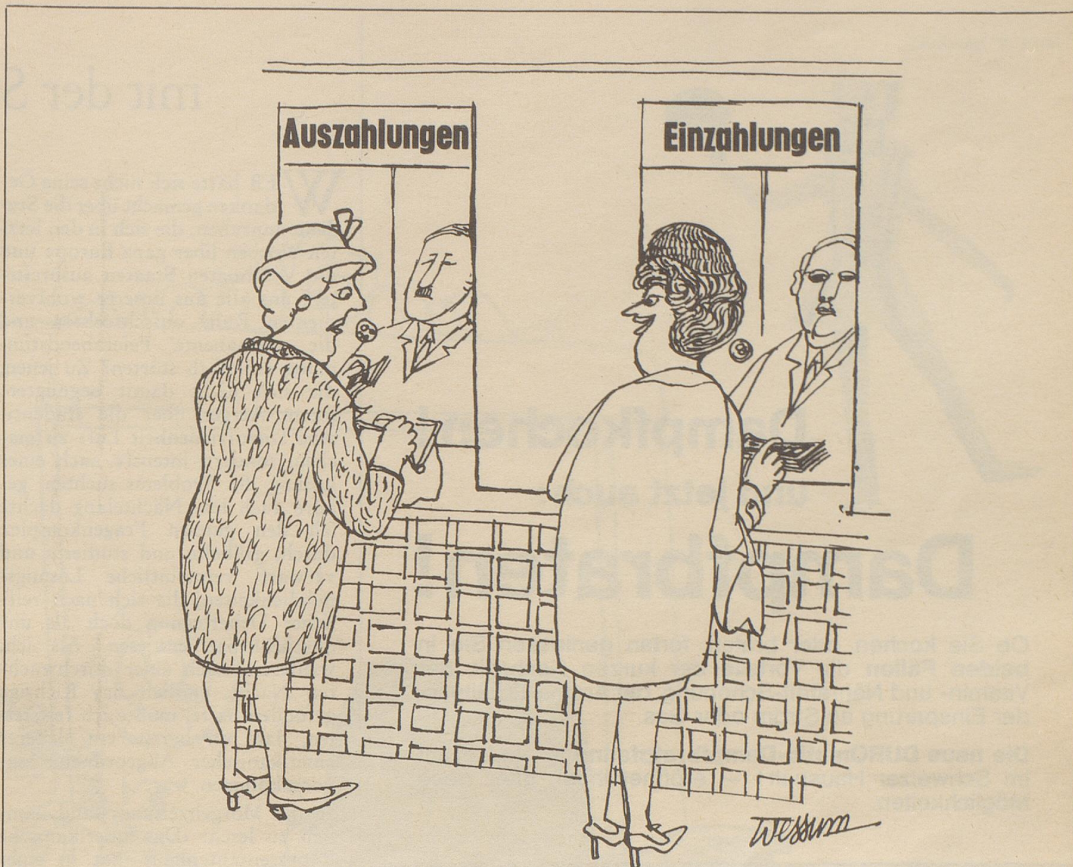
«... das habe ich ihm am Munde abgespart!»

«In einem Restaurant entdeckte ich ein Plakat: 'Wenn Ihre Frau nicht kochen kann, lassen Sie sich nicht scheiden! Essen Sie bei uns und behalten Sie Ihre Frau als Hobby!»