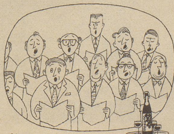
Singen macht Durst... ihn löscht der herrliche, vollmundige Traubensaft RESANO