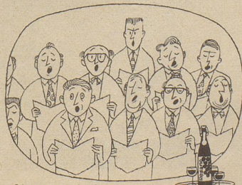
Singen macht Durst... ihn löscht der herrliche, vollmundige Traubensaft RESANO