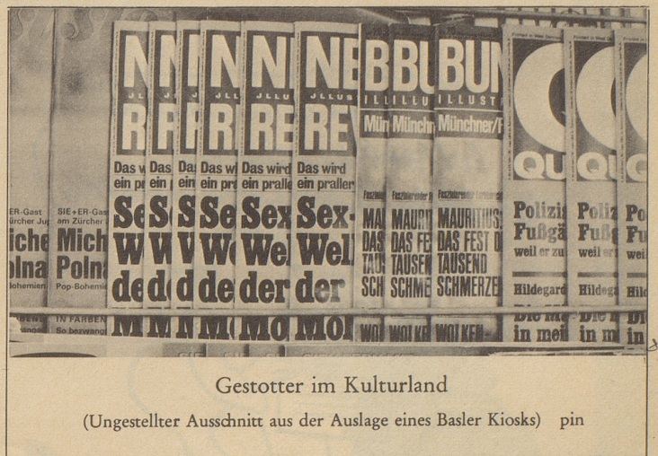
Gestotter im Kulturland

Offene Krampfadern hartnäckige Ekzeme eitrige Geschwüre bekämpft auch bei veralteten Fällen die vorzügliche, in hohem Maße reiz- und schmerzlindernde Spezial-Heilsalbe Buthaesan. Machen Sie einen Versuch. Tuben zu 30 g; 50 g; Klistrikpack. 250 g. In Apoth. u. Drog. Buthaesan