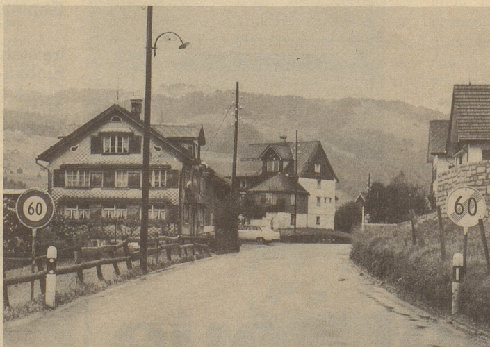
Beispiel konserprogressativer Verkehrssignalisation in Ebnet-Kappel