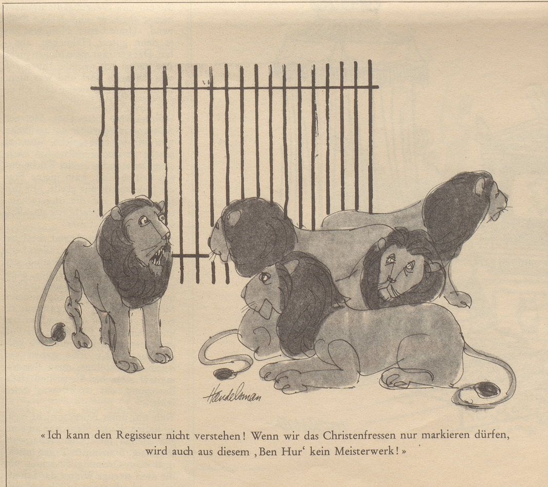
«Ich kann den Regisseur nicht verstehen! Wenn wir das Christenfressen nur markieren dürfen, wird auch aus diesem 'Ben Hur' kein Meisterwerk!»