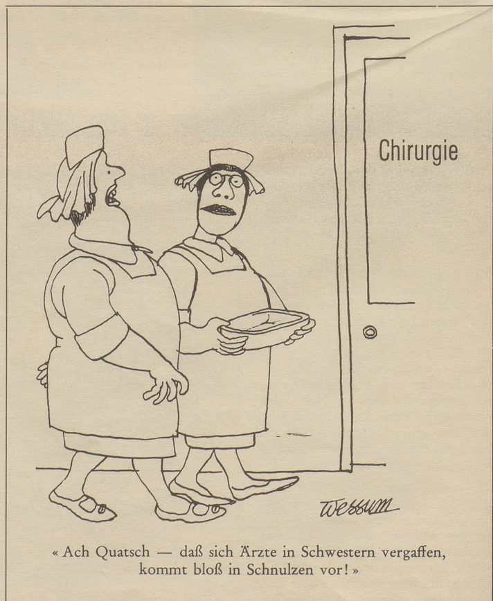
« Ach Quatsch — daß sich Ärzte in Schwestern vergaffen, kommt bloß in Schnulzen vor! »

Ich möchte eine andere Lösung vorschlagen. Eine sehr einfache Lösung. Sie kostet nichts, als die Ueberwindung, sie auszuprobieren: Eltern, tauscht eure Kinder aus! Für ein Wochenende, ein paar Tage oder zwei drei Wochen... Die heilsamen Folgen eines solchen Tausches scheinen mir vielfältig: Das Kind hat die Chance, einmal ganz anders zu sein. Zu Hause ist sein Verhalten weitgehend geprägt von dem, was die Eltern zu erwarten gewohnt sind. Eine bestimmte Rolle innerhalb der Familie ist ihm aufgebürdet. Wie befreiend, diese Rolle