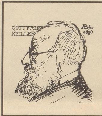
Gottfried Keller, gezeichnet von Arnold Böcklin

Die Schmiedezunft führte in ihrer «Schmiedstube» ein Festspiel Kellers glanzvoll auf. Der Dichter war als Ehrengast dabei, und man erwartete von ihm einen feierlichen Toast. Aber er war kaum zum Reden zu bringen. Schließlich stand er doch noch auf und sagte: «Schon als junger Knabe hatte ich Sympathien für die Schmiedstube. Da meine Eltern in der Nähe wohnten, war mir Gelegenheit geboten, die Festlichkeiten der ehrsamten Zunftgenossen aus der Ferne mitzumachen; und wenn sie dann lärmten wie die Schweine, war das immer eine besondere Freude für mich.» Sprach's, verstummte und setzte sich.