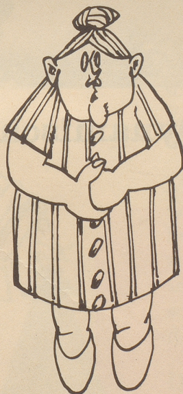
Frau Nägeli, Hausfrau ist fest überzeugt, einen Marsmenscheinfall beobachtet zu haben und stellt kategorisch in Abrede, daß es sich um eine Zivilschutzübung gehandelt habe.