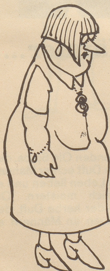
Fräulein B. (will ungenannt bleiben), Medium in einem Spiritistenklub, erklärt, selber von einem fernen Planeten abstammen.