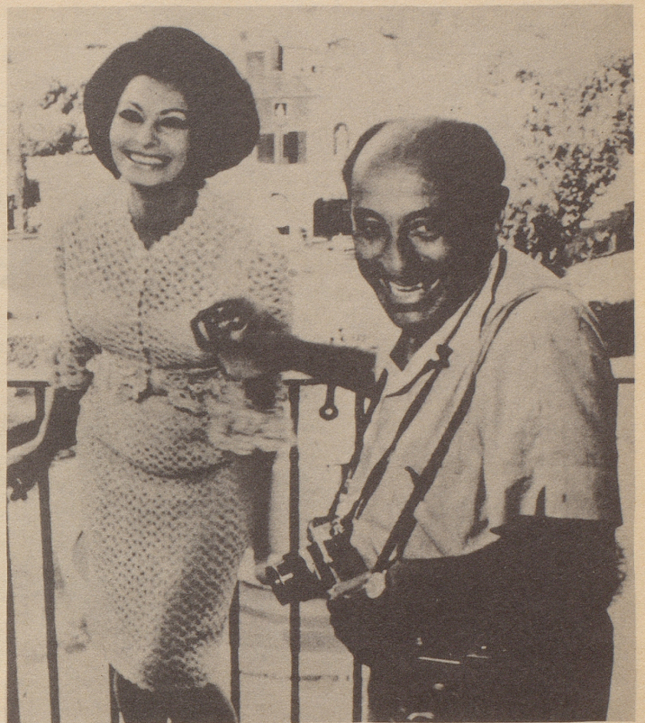
Alfred Eisenstaedt, ein weltberühmter Fotograf, wird dafür bezahlt, dass er die schönsten Frauen der Welt fotografiert (wie z. B. Sophia Loren). Er ist stets auf der Reise zu Orten, wo die meisten gerne ihre Ferien verbringen möchten – zur Südsee, zur Karibischen See, zu den Hauptstädten in aller Welt.

Sie an Ihren Fotografien besser machen können. Dann schreiben sie Ihnen einen ausführlichen, persönlichen Brief mit Ratschlägen und Anleitungen. Der Unterricht ist ebenso persönlich wie die Ausbildung, die ein vielversprechender Assistent von einem Meisterfotografen erhält.