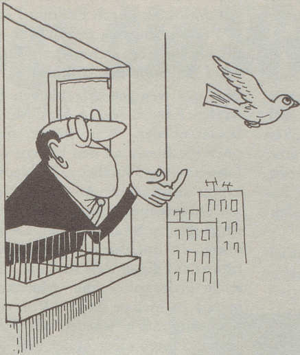
Armee-Brieftauben für Expreßbriefe, die wirklich vor den gewöhnlich beförderten Briefen ankommen sollten