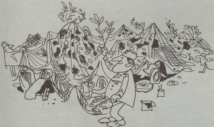
Tarnnetze über Autofriedhöfe – eine wirksame Unterstützung der Verkehrs- und Verschönerungsvereine!