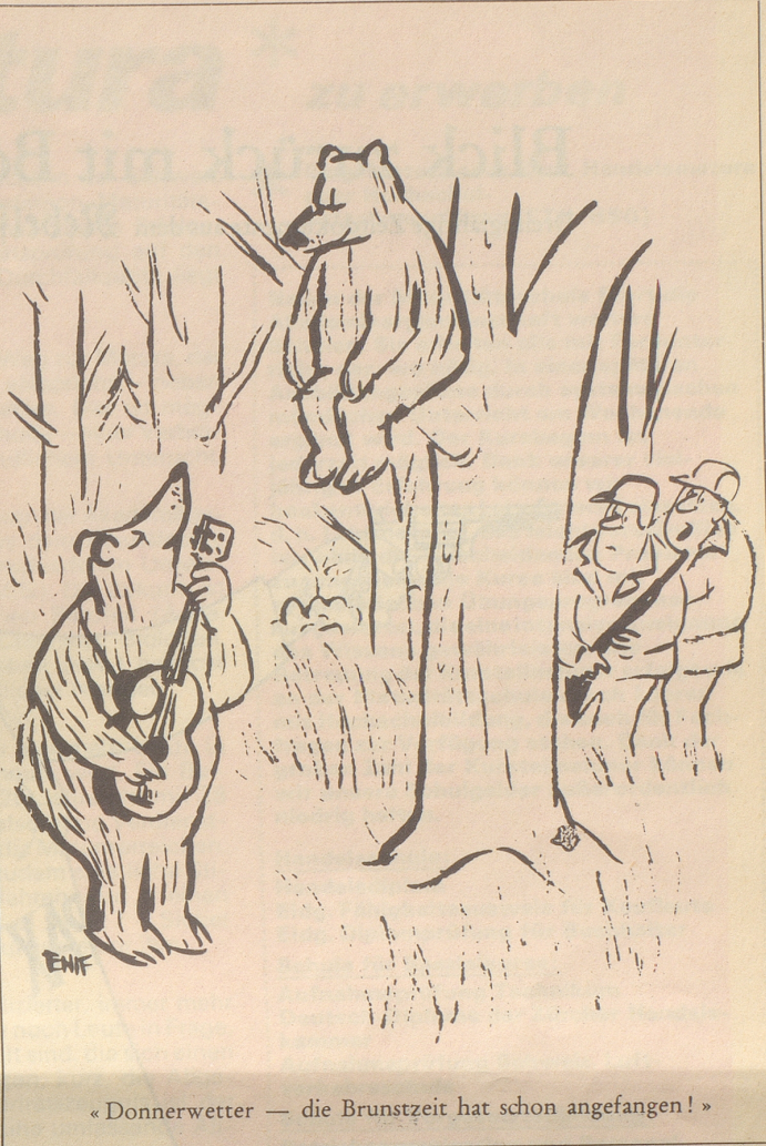
«Donnerwetter — die Brunstzeit hat schon angefangen!»