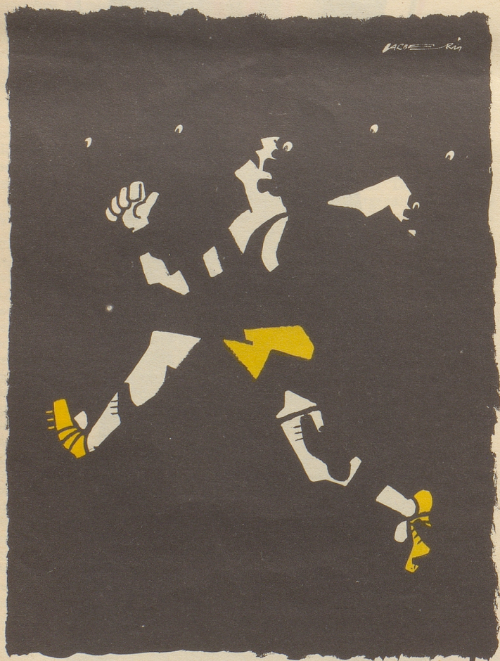
Vexierbild aus Mexico

Bundesrat Celio am 24. Oktober im Schweizer Radio