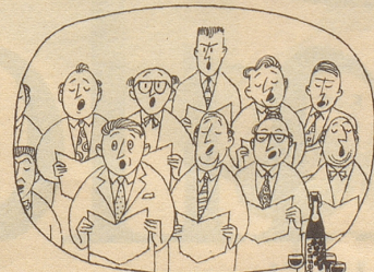
Singen macht Durst... ihn löscht der herrliche, vollmundige Traubensaft

Damit Sie mich nicht wieder falsch verstehen: Auch in meinen Augen ist der Kommunismus, wie er sich in den letzten vierzig Jahren entwickelt hat, eine widerwärtige Mischung von dogmatisch erstarrter, verkalkter, toter Doktrin und heuchlerisch als wahre Demokratie