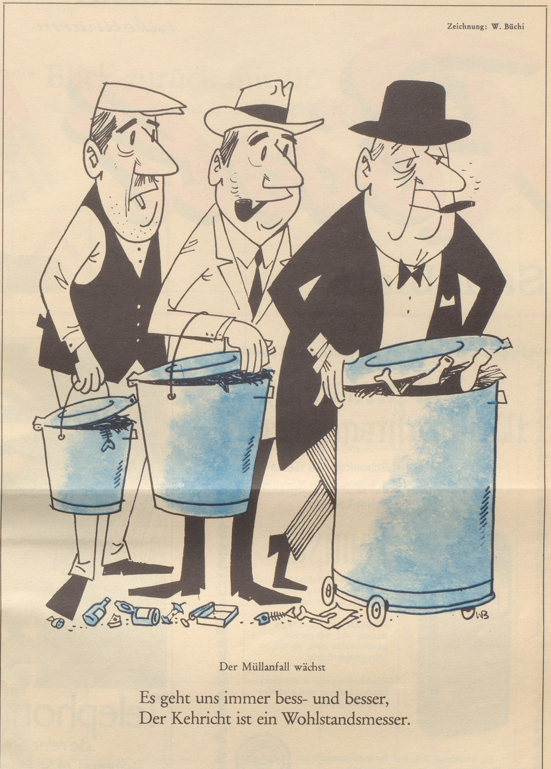
Der Müllanfall wächst

Bezugsquellennachweis: E. Schlatter, Neuchâtel