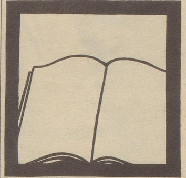
Lesebuch (Spezialauflage für Analphabeten)