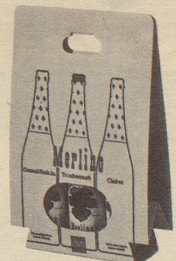
im 3er Multipack nur Fr. 7.85 statt Fr. 8.85

Sie können und werden es sein, wenn Sie schon als Auftakt viel frohe Laune auf den Tisch stellen mit Merlino Grand Raisin und Merlino Clairnet. Diese neuen Dreistern-Traubensäfte sind eine Zierde für jeden Tisch: der weisse, moussierende Grand Raisin ist Auftakt und Höhepunkt jedes Festes, und der fruchtig-rubinrote Clairnet passt sehr gut zu den Mahlzeiten und den modernen Snacks. Sie dürfen damit grosszügig sein, denn die Flasche kostet nur Fr. 2.95 (mit Rabatt, Einwegflasche ohne Pfand). Erhältlich in Lebensmittelgeschäften, Reformhäusern, Drogerien und durch unsere Depositäre in der ganzen Schweiz.