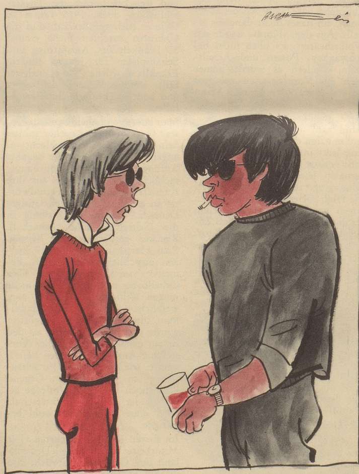
Zum erstmal wurden an den Olympischen Spielen Geschlechtskontrollen durchgeführt

Präsident Johnson will jedem amerikanischen Touristen eine Steuer abknöpfen, der im Ausland pro Tag mehr als sieben Dollar ausgibt. Die europäischen Betriebe mögen aber ob dem Mangel an Fremdenverkehr nicht verzweifeln! Wenn es wirklich nicht mehr geht, werden die Amerikaner schon wieder kommen und sie übernehmen. Ohne auf ihren Reisespesen über sieben Dollar auch nur die geringste Steuer zu zahlen!