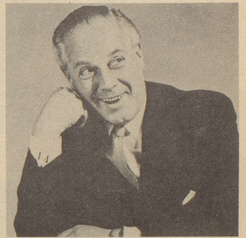
Wer sagt, daß man mit 60 alt sein muß? Der Gesundheit sind keine Grenzen gesetzt.