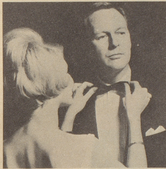
Der Telepander verlängert Ihr Leben. Ihre jugendliche Spannkraft bleibt Ihnen erhalten.