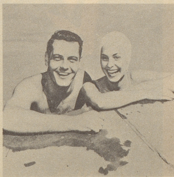
Wenn andere Ihres Alters müde und abgespannt wirken, bleiben Sie – dank dem Telepander – jung und aktiv.