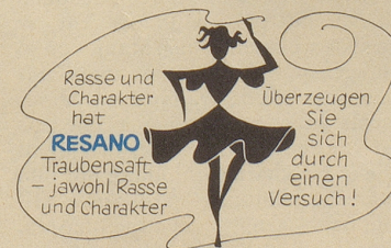
Hersteller: Brauerei Uster

Als Prunkstück und gleichzeitig als Beweis dafür, daß in Zürich tatsächlich Leute mit fasnächtlichen Talenten leben, wird in der Regel als Nummer eins der Künstlermaskenball angeführt. Er gilt – samt dem montäglichen Kehraus – als