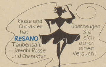
Hersteller: Brauerei Uster

Als Prunkstück und gleichzeitig als Beweis dafür, daß in Zürich tat-sächlich Leute mit fasnächtlichen Talenten leben, wird in der Regel als Nummer eins der Künstler-maskenball angeführt. Er gilt – samt dem montäglichen Kehraus – als