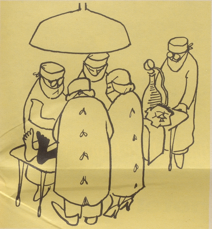
Wenn man Herzbanklehrlinge den Schalter bedienen läßt ...