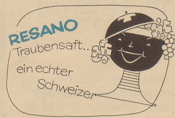
Bezugsquellen durch: Brauerei Uster