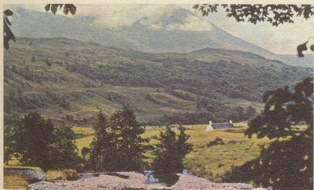
Ben Nevis, Schottland

Windsor-Ferien bieten Ihnen ein raffiniertes Programm. Übrigens: auch für Ihren wählerischen Geschmack ist das Richtige dabei. Sie können bleiben, so lange Sie wollen, Sie können fahren, wohin Sie wollen. Allein – wenn Sie wollen. Oder mit einem Reiseleiter. Und bei einem Windsor-Ferien-Pauschalpreis ist wirklich alles eingeschlossen – das spart Ärger und Zeit. Sobald Sie sich für Windsor-Ferien angemeldet haben, erledigt sich alles andere für Sie von allein.