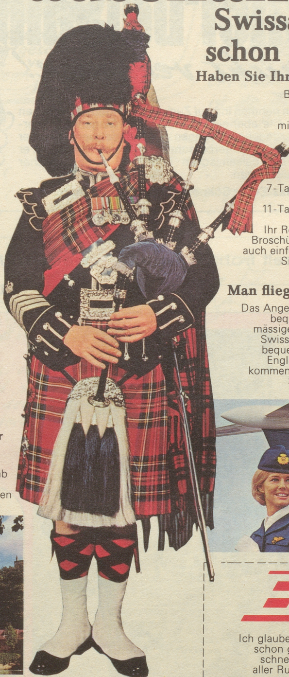
Ein Major der Schottischen Garde mit Dudelsack