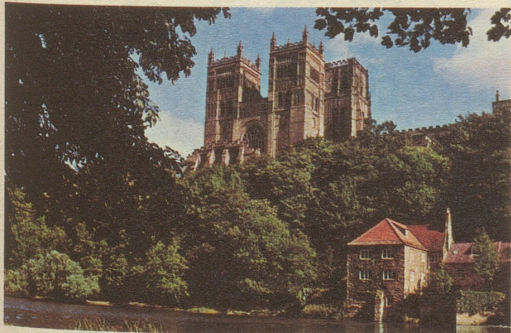
Die Kathedrale von Durham

Sie reisen innerhalb von Stunden direkt von daheim in das Herz von London. Dann geht's ab zu einer Rundfahrt durch die anmutigsten Landstriche Englands und Schottlands – wie den Lake-Distrikt und das Schottische Hochland.