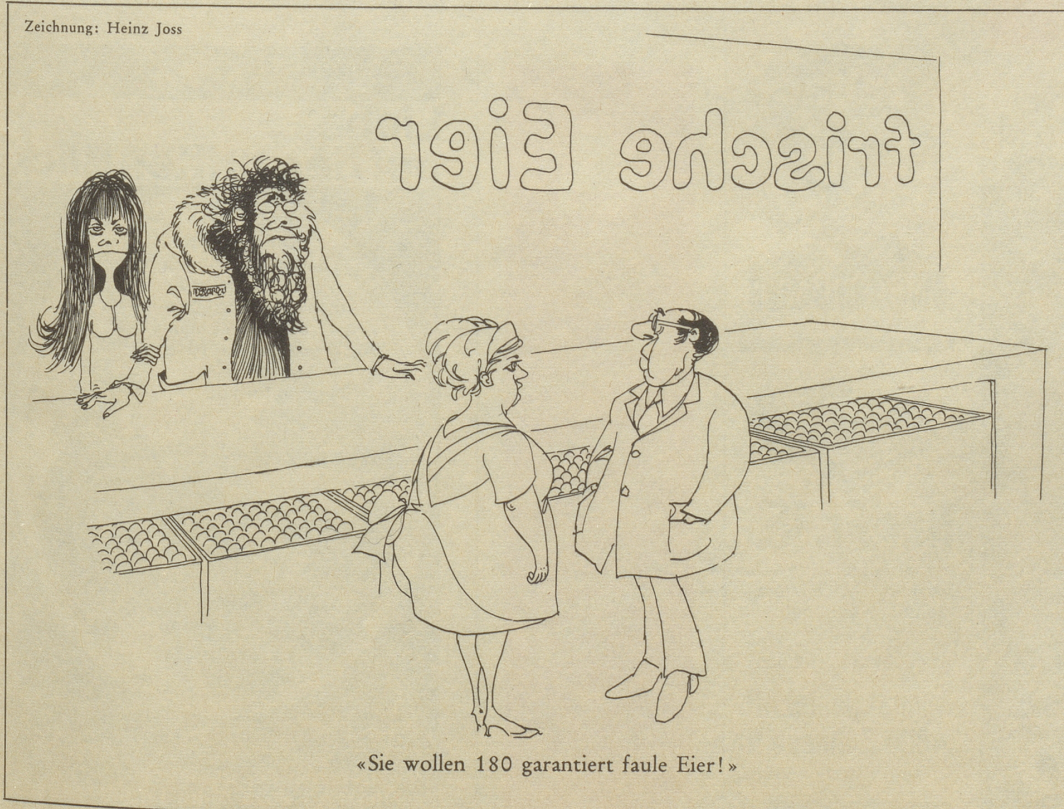
Zeichnung: Heinz Joss

«Ach», seufzt die Dame, «ich bin einfach des jahrelangen Alleinseins müde!» tr