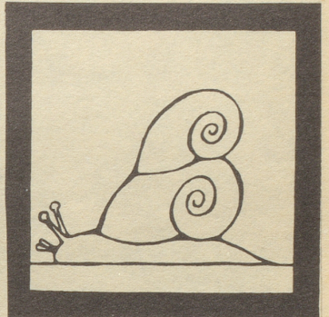
Wohlhabende Schnecke mit Zweiflhaus