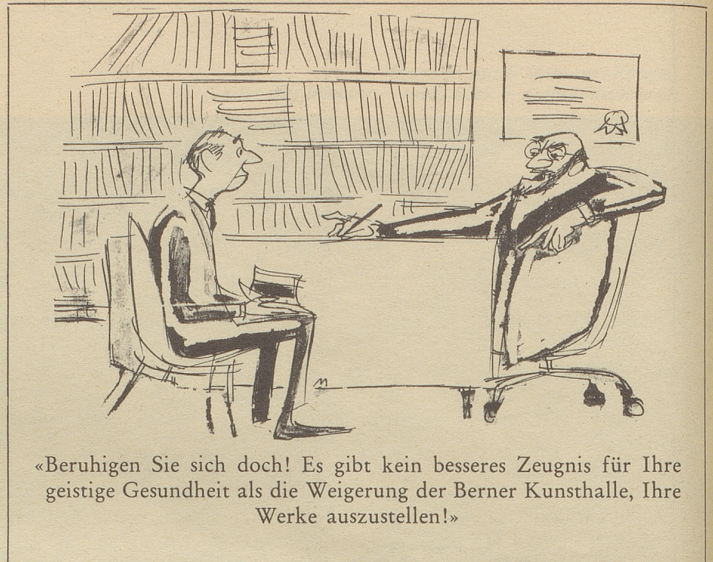
«Beruhigen Sie sich doch! Es gibt kein besseres Zeugnis für Ihre geistige Gesundheit als die Weigerung der Berner Kunsthalle, Ihre Werke auszustellen!»

Und nun der neueste Bildband « Maurus und Madleina »: Kusine Madleina aus der Stadt schreibt und besucht «... Maurus von Bellavarda, hoch oben in den Bündner-Bergen», nachdem Maurus seine Kusine in der Stadt besucht hat. Wer Carigiet kennt, weiß, daß es dabei an turbulenten Abenteuern nicht fehlte (Schweizer Spiegel-Verlag). Johannes Lektor