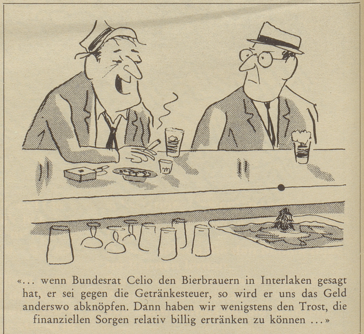
«... wenn Bundesrat Celio den Bierbauern in Interlaken gesagt hat, er sei gegen die Getränkesteuer, so wird er uns das Geld anderswo abknöpfen. Dann haben wir wenigstens den Trost, die finanziellen Sorgen relativ billig ertränken zu können ...»