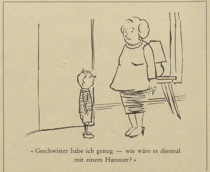
«Geschwister habe ich genug — wie wäre es diesmal mit einem Hamster?»

Am meisten freut mich natürlich, daß ich endlich einmal Zeit habe zum Lesen, zum Briefe schreiben, zum Besuche machen und Besuche empfangen. Und den Nebelspalter darf ich nun ohne schlechtes Gewissen gleich am Mittwoch ver-