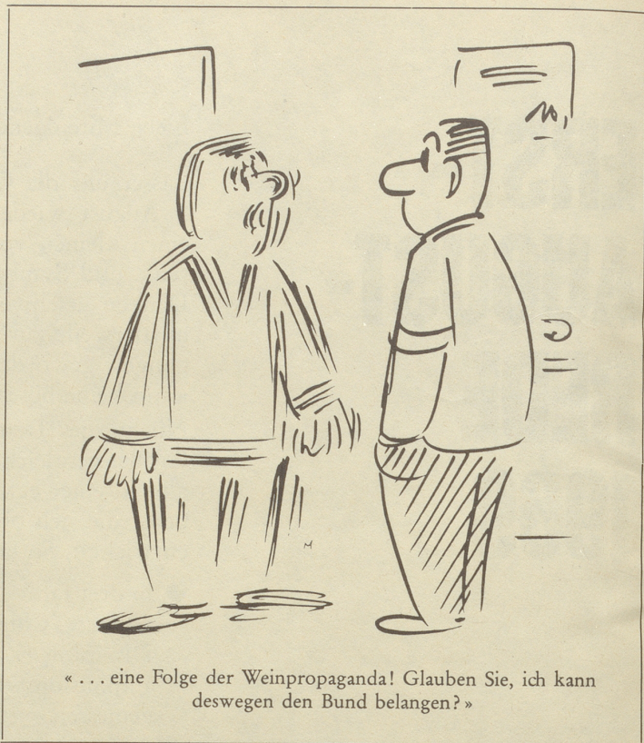
«... eine Folge der Weinpropaganda! Glauben Sie, ich kann deswegen den Bund belangen?»