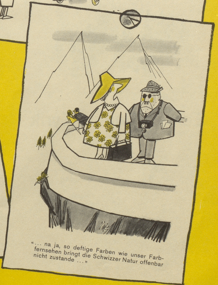
«... na ja, so deftige Farben wie unser Farbfernsehen bringt die Schwizzer Natur offenbar nicht zustande ...»