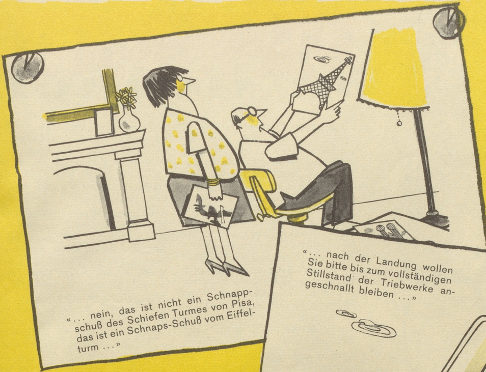
«... nein, das ist nicht ein Schnappschuß des Schiefen Turmes von Pisa, das ist ein Schnaps-Schuß vom Eiffelturm ...»