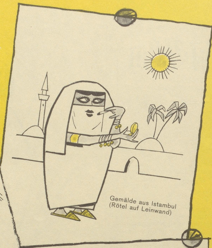
Gemälde aus Istanbul (Rötel auf Leinwand)