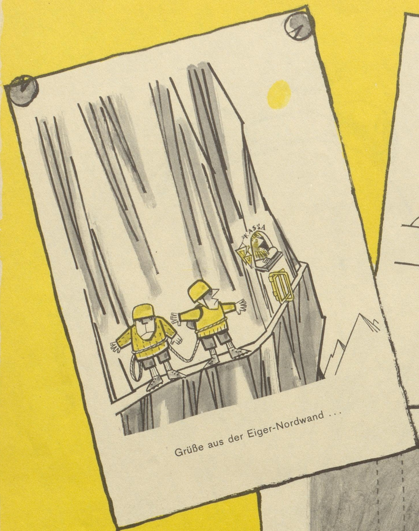
Grüße aus der Eiger-Nordwand ...