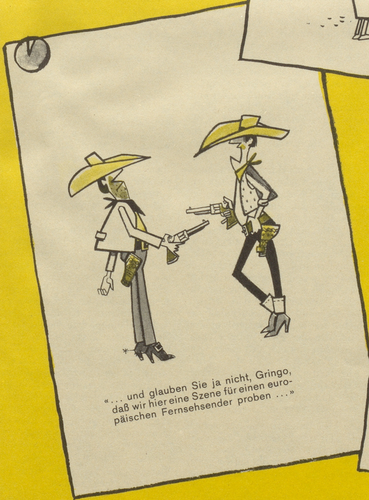
«... und glauben Sie ja nicht, Gringo, daß wir hier eine Szene für einen europäischen Fernsehsender proben ...»