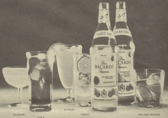
DAIQUIRI COLA CITRUS TONIC ON-THE-ROCKS