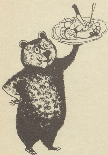
Ueli der Schreiber: