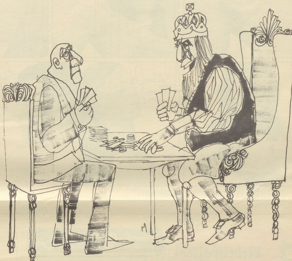
«Vier Könige — ich inbegriffen!»