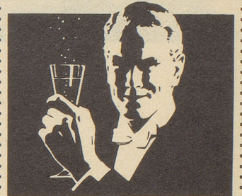
Ihr Sekt für frohe Stunden