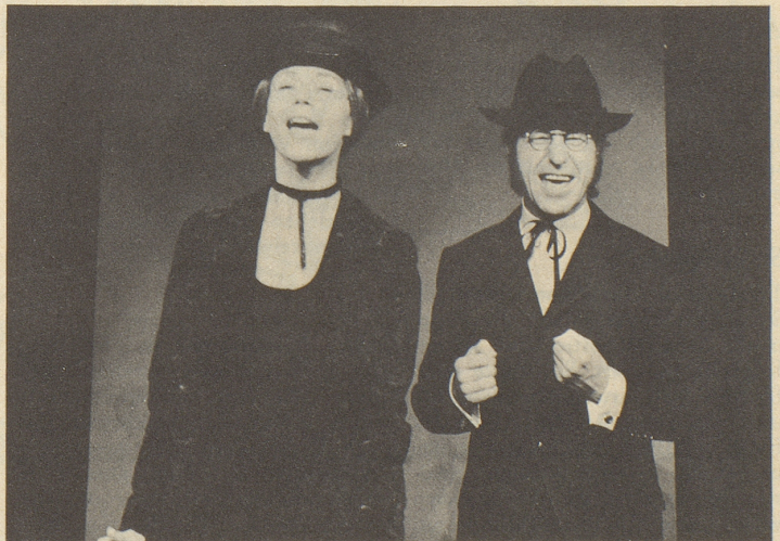
...sowie jung und hormongespritzt im Alter.