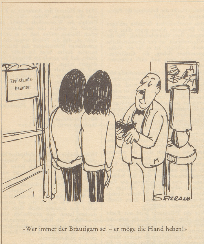
«Wer immer der Bräutigam sei – er möge die Hand heben!»