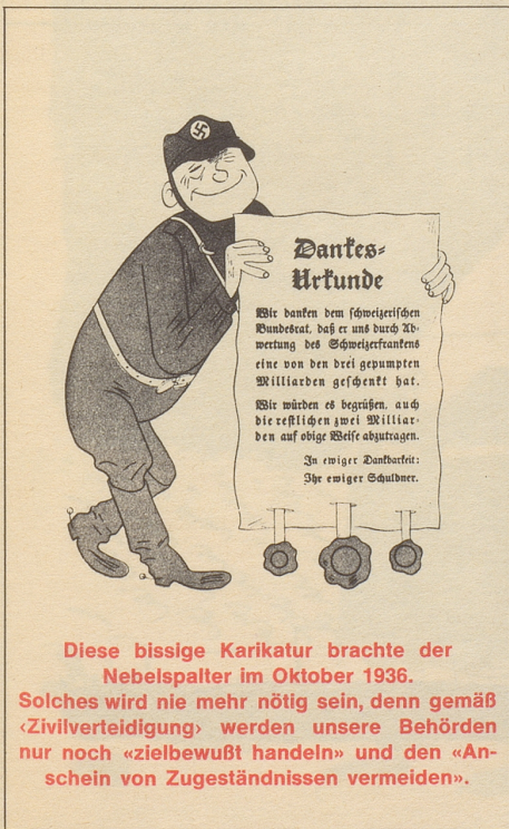
Diese bissige Karikatur brachte der Nebelspalter im Oktober 1936. Solches wird nie mehr nötig sein, denn gemäß «Zivilverteidigung» werden unsere Behörden nur noch «zielbewußt handeln» und den «Anschein von Zugeständnissen vermeiden».

Nämlich kein Zweifel an der Standhaftig-