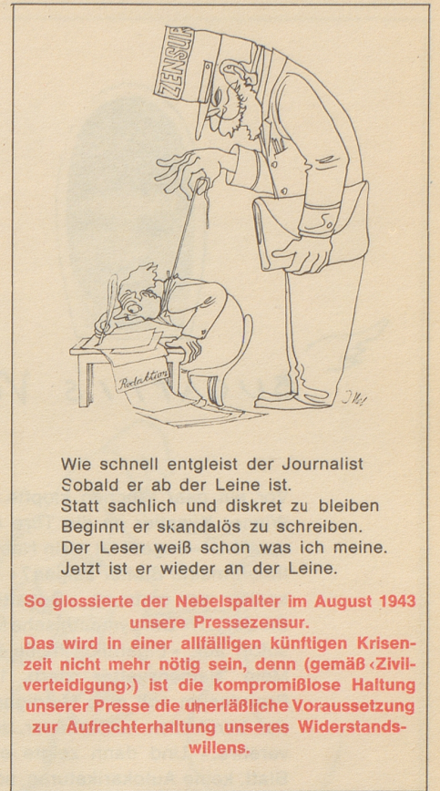
Wie schnell entgleist der Journalist Sobald er ab der Leine ist. Statt sachlich und diskret zu bleiben Beginnt er skandalös zu schreiben. Der Leser weiß schon was ich meine. Jetzt ist er wieder an der Leine.

Die drei hatten den Mut, abzulehnen. Sie blieben ihrer Aufgabe treu, auch unter der neuen Ordnung die Wahrheit zu sagen, so wie sie sie unter der alten Ordnung gesagt hatten. Sie wurden der Gefährdung der Staatssicherheit schuldig befunden und zu langjährigen Zuchthausstrafen verurteilt ...»