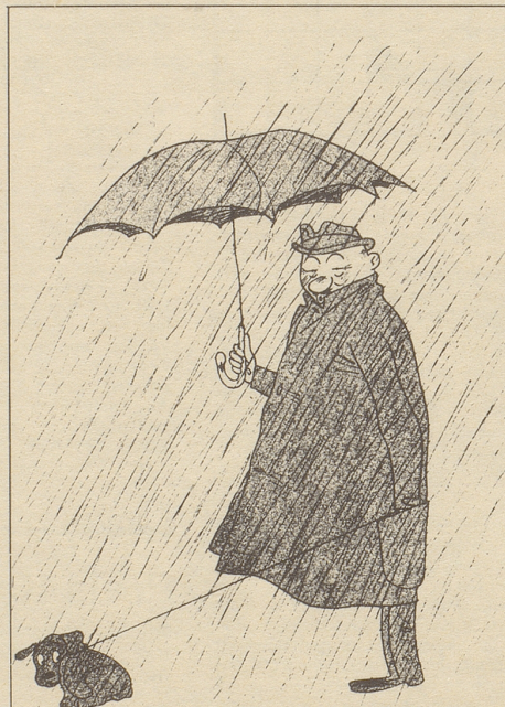
«Es regnet nüd!»

«Zivilverteidigung» korrigiert diese Neigung und stellt – für künftige Fälle – lakonisch fest: «Wenn eine Macht unser Land angreifen will, so tut sie es, gleichgültig, welche Haltung (zum Beispiel) unsere Presse einnimmt ...»