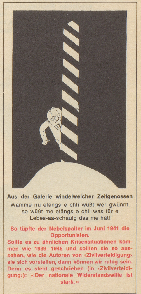
Aus der Galerie windelweicher Zeitgenossen Wämme nu efängs e chli wüßt wer gwünnt, so wüßt me efängs e chli was für e Lebes-aa-schauig das me hät!

So glossierte der Nebelspalter im August 1943 unsere Pressezensur. Das wird in einer allfälligen künftigen Krisenzeit nicht mehr nötig sein, denn (gemäß «Zivilverteidigung») ist die kompromißlose Haltung unserer Presse die unerläßliche Voraussetzung zur Aufrechterhaltung unseres Widerstandswillens.