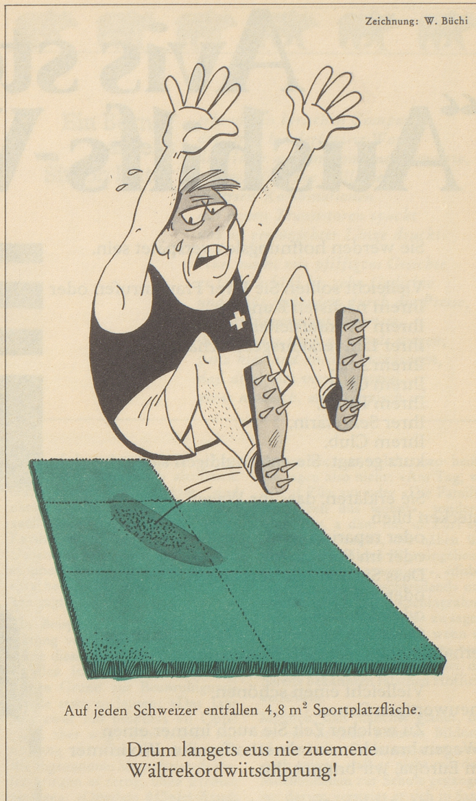
Zeichnung: W. Büchi