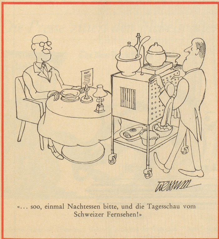
«... soo, einmal Nachtsessen bitte, und die Tagesschau vom Schweizer Fernsehen!»