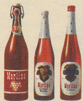
die drei beliebten Merlino Traubensäfte

Merlino Grand Raisin , weiss, moussierend, prickelnd, der passende Auftackt für jedes Fest, Merlino Clairret , rubinrot, fruchtig, passend zu den Mahlzeiten – beide in der schlanken Einweg-flasche, zu nur Fr. 2.95 (mit Rabatt), Merlino weiss und rot in der vorteilhaften Literflasche zu nur Fr. 2.65 statt Fr. 2.95 (mit Rabatt).