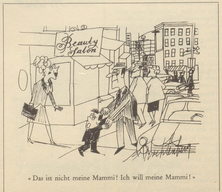
« Das ist nicht meine Mammi! Ich will meine Mammi! »

Solche und ähnliche Zeiterscheinungen pflegen wir bei Tisch mit unseren Sprößlingen zu diskutieren, und unserer erzieherischen Sendung bewußt, sparten wir hier nicht mit verachtungsvollen Kommentaren für solch verruchten Snobismus. Leider kam ich nicht dazu, alle meine vorrätigen träfen Argumente in die Diskussion zu werfen,