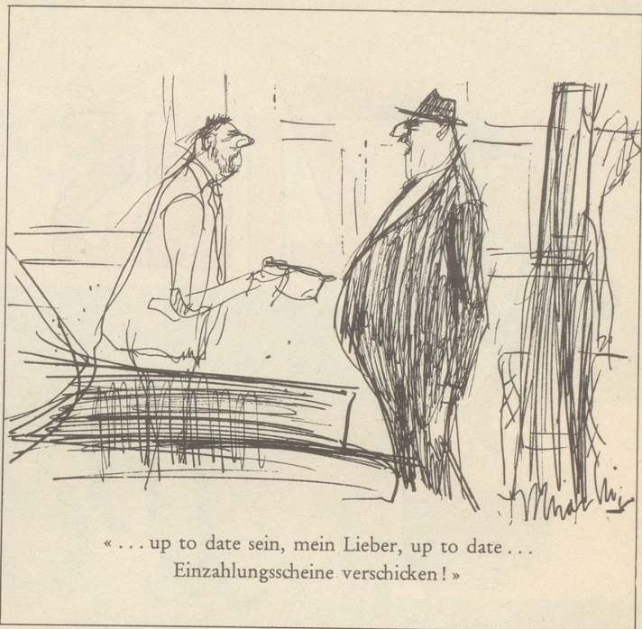
«... up to date sein, mein Lieber, up to date... Einzahlungsscheine verschicken!»