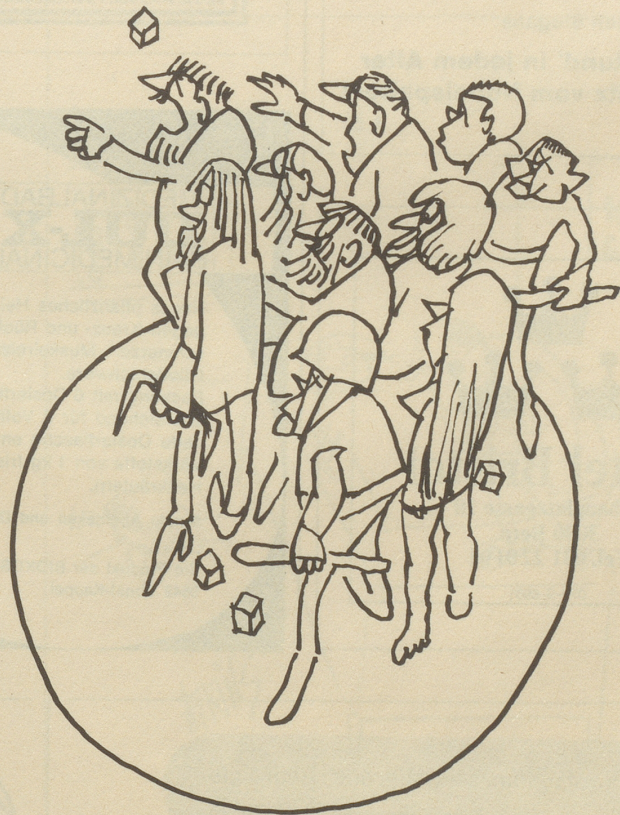
Welten stoßen aufeinander