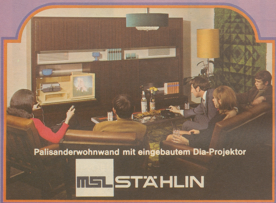
Palisanderwand mit eingebautem Dia-Projektor

In einem Inserat offeriert eine Firma ihre Waren (postfrisch). Schön, aber eigentlich hätte ich sie lieber etwas frischer. fis