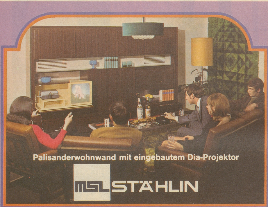
Palisanderwand mit eingebautem Dia-Projektor

In einem Inserat offeriert eine Firma ihre Waren (postfrisch). Schön, aber eigentlich hätte ich sie lieber etwas frischer. fis